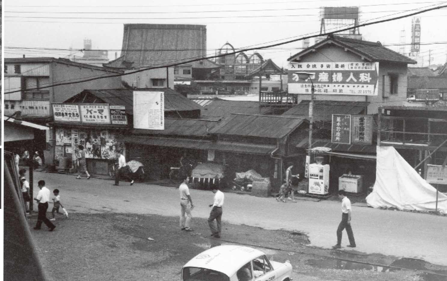
阪急茨木駅駅前風景 線路西側。写真左端に駅舎の屋根がのぞいている。大阪万博に合わせた大規模再開発の、少し前の駅前の姿。中央左奥に茨木別院の大屋根が見えている。〈永代町・昭和43年〉

昭和23年の市制施行から70年——。 ふるさと「茨木市」を、400点もの貴重な写真、 懐かしい写真で振り返る珠玉の一冊。