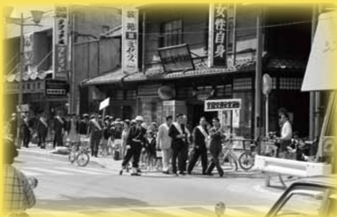
中央通り、心斎橋商店街入口西側付近 (元町・昭和53年)

市制を施行して70年の節目にあたり、これまで先人が築き、今日の姿へと発展してきた「ふるさと茨木」を知り、感じることで、市民の皆さまのまちへの「誇りと愛着」を高めるとともに70周年の意義と喜びを市民の皆さまと分かちあうこと、さらには、多くの人が本市の魅力を知り、興味を持つことで、わがまち茨木の「確かな未来」を目指します。