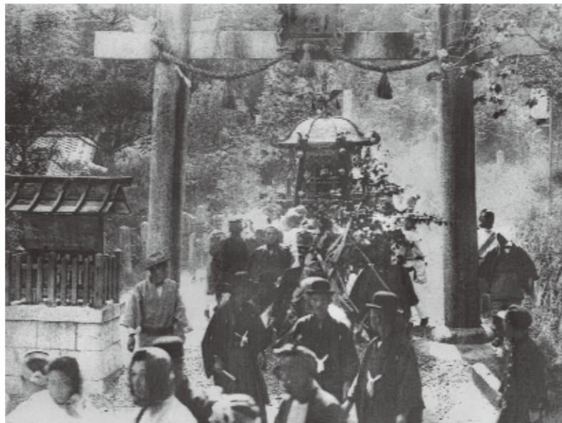
▶阿為神社の春祭り 5月7日と8日に行われていた、同社の例大祭（現在は5月3～4日）。安威村内を巡った神輿が、神社鳥居にさしかかる。前を行く羽織袴の男性たちは山高帽をかぶっている。〈安威・昭和7年〉