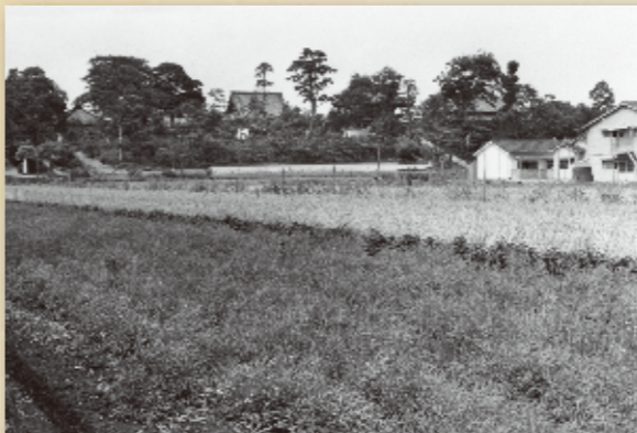
宅地化前の総持寺周辺 (総持寺・昭和四十年)