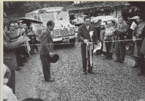
忍頂寺線バスの開通式 (忍頂寺・昭和三十九年)