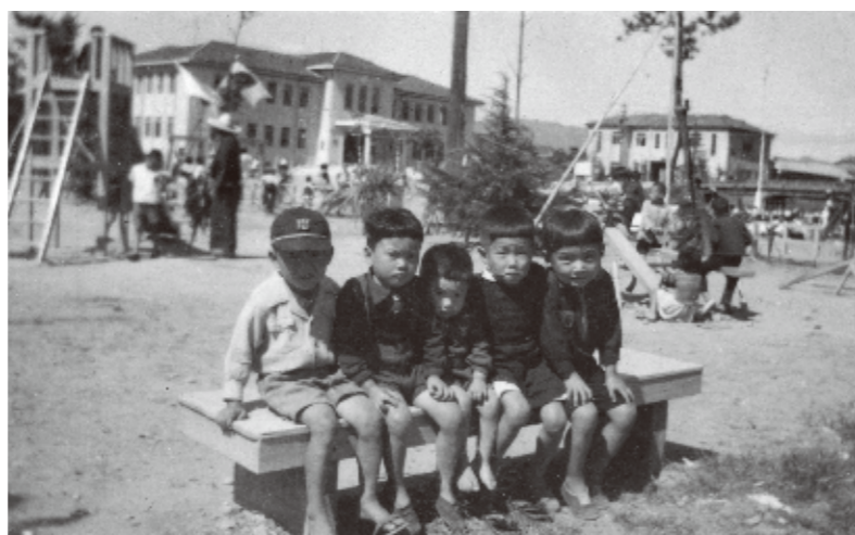
▲茨木公園の子どもたち 現在の中央公園南端付近。写真左奥にこの年竣工したばかりの市庁舎が写る。茨木市はこの2年前、昭和23年に市制を施行した。〈駅前・昭和25年〉