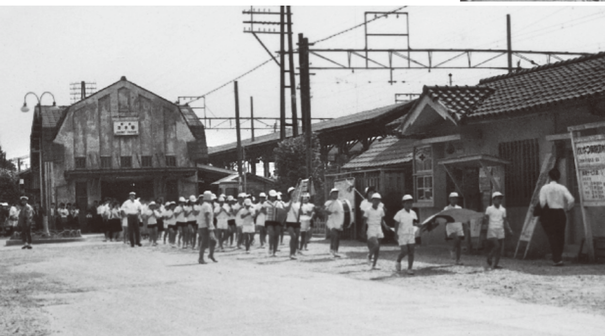
◀国鉄茨木駅前をパレード 左奥に旧駅舎。玉島小学校の児童たちが「児童愛護旗伝達」の鼓笛パレード。登下校の際に使われる鳥のマークの黄色い旗は、昭和35年、大阪府により制定された。〈駅前・昭和37年〉

昭和23年の市制施行から70年——。 ふるさと「茨木市」を、400点もの貴重な写真、 懐かしい写真で振り返る珠玉の一冊。