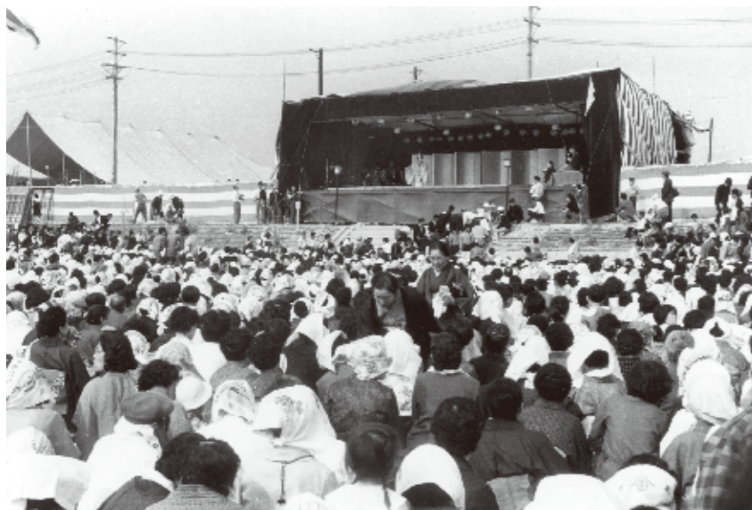
◀茨木辯天（冥應寺）に美空ひばりが来演「辯天さん」の名で親しまれる冥應寺は、この年落慶した。落慶大祭典には美空ひばりも出演。人々が陽射しをよけるため、頬被りして集まる。〈西穂積町・昭和39年〉