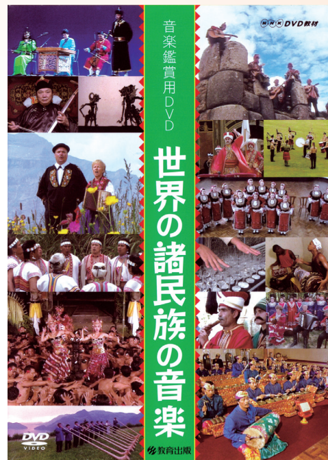
世界の諸民族の音楽 価格 16,500円 (本体 15,000円 + 税)