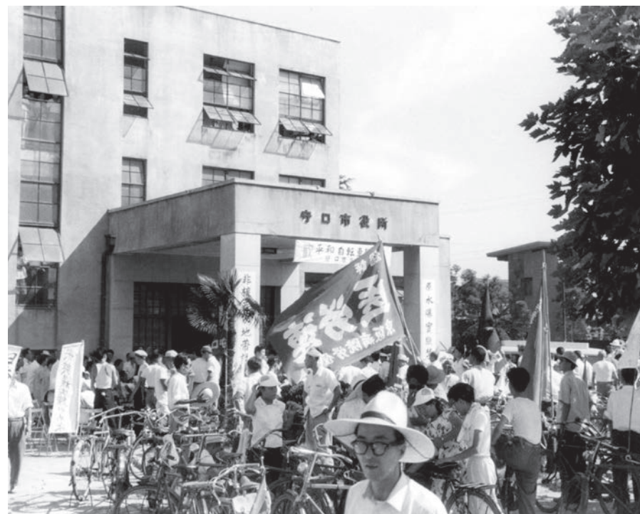
▶守口市役所前の国民平和大行進自転車リレー 戦後、米ソ冷戦時代を背景に昭和29年、アメリカがビキニ環礁で行った水爆実験により第五福竜丸が被曝。この事件を契機に日本では原水爆禁止運動が起こった。平和行進は、同33年8月の第4回原水爆禁止世界大会に向けて、広島から会場の東京まで人びとが歩いたのが始まりである。〈守口市京阪本通・昭和30年代半ば〉