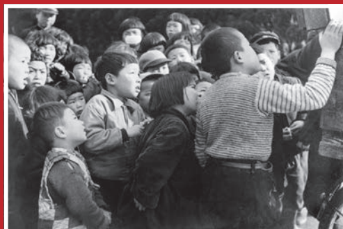
紙芝居屋さん（大東市内・昭和30年頃）