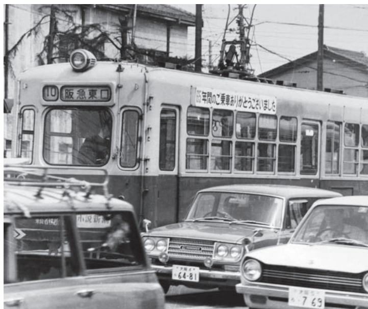
▼さようなら大阪市電 大阪市営電気鉄道（大阪市電）の都島守口線が京阪本通一丁目（守口町駅）まで開通したのは昭和6年のこと。以来、戦後まで守口と大阪を結ぶ重要な交通手段であったが、やがてモータリゼーション進展の妨げとなり、同44年4月、大阪市電は全廃された。〈守口市内・昭和44年〉