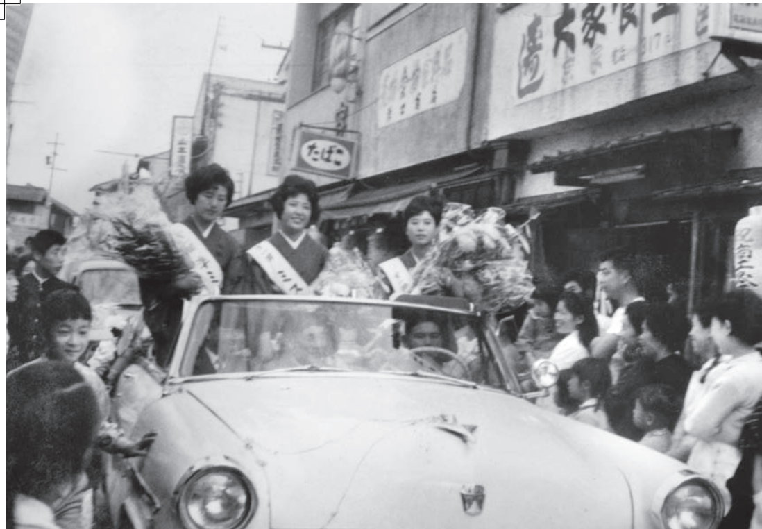
◀「ミス門真」のパレード 萱島駅前市場開設時に行われた商工祭で的一幕。第1回「ミス門真」たちが和服姿で駆けつけ、笑顔振りまきながらオープンカーで商店街を進む。〈門真市上島町・昭和34年〉