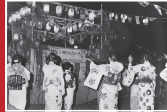
▲市制一周年記念の夕べ（四條畷市内・昭和46年）