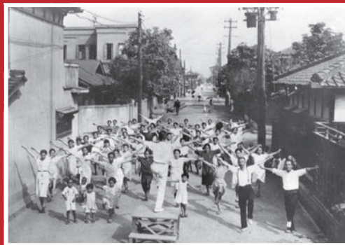
朝のラジオ体操（守口市豊秀町・昭和17年）