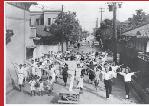
◀朝のラジオ体操（守口市豊秀町・昭和17年）