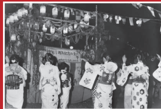
市制一周年記念の夕べ（四條畷市内・昭和46年）