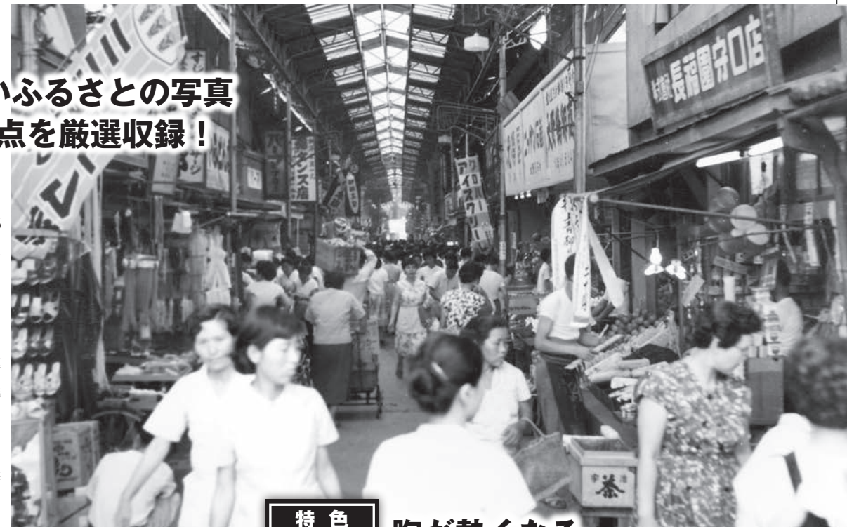
▶京阪商店街の賑わい 京阪商店街は土居地区商店街を構成する5つの商店街のうちのひとつ。写真は、土居地区商店街の中心にある十字路から西向きに撮っており、奥方向へ進むと現在の内環状線に至る。靴店や青果店、家具店が建ち並び、「アイスクリーム」の幟も見える。活気溢れる高度経済成長期を映した一枚。〈守口市金下町・昭和32年・提供=守口市魅力創造発信課〉