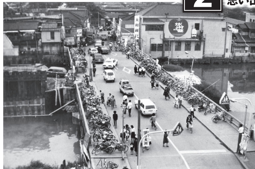
◀住道駅前大橋 住道駅北で寝屋川に架かる。橋の両側には歩道が設けられているが、自転車所狭しと置かれ、人びとは車道を闊歩する。この時、橋の下では、恩智・寝屋川改修工事に伴い、護岸改修と中ノ島の撤去工事が行われていた。写真右上は移転前の大和銀行住道支店。〈大東市赤井・昭和49年〉