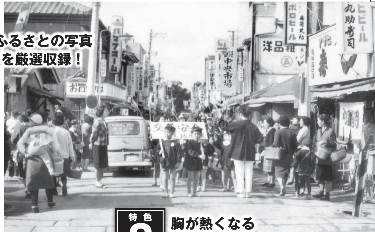
▶楠公通り商店街で交通安全パレード 小楠公墓所から四條畷神社までまっすぐに伸びる参道沿いの楠公通り商店街を畷幼稚園児たちが行進。単線時代の国鉄片町線の南野踏切前で「一旦停止」しているようだ。踏切から西(写真奥)には平成初期まで2つの市場があり、そのうち「畷中央市場」の看板が見える。〈四條畷市楠公・昭和42年〉