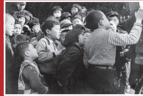
◀紙芝居屋さん（大東市内・昭和30年頃）