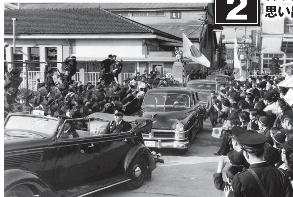
◀皇太子の行啓 皇太子（現上皇）がこの日、松下電器産業本社と当時の花形・ラジオ事業部をご訪問になった。写真は、ラジオ事業部を出る車列。従業員らが日の丸の小旗を手に、身を乗り出してお見送りをする。ラジオ事業部の跡地には後に「パナソニックミュージアム」が建設された。〈門真市門真・昭和28年〉