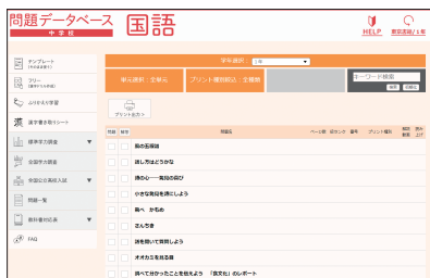
多彩なプリントから選択