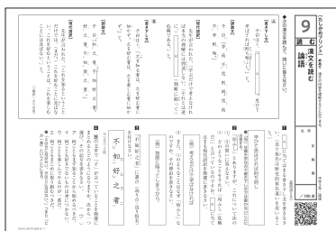
たしかめプリント

必要な環境 ●OS：①Windows 10/11, ②iOS 10以降, ③Android 8以降, Chrome OS ●ブラウザ※：Microsoft Edge (①), Safari (②), Google Chrome (①③) ●利用形態：クラウド配信 ●プラグイン等：端末にQRコードリーダーが必要。