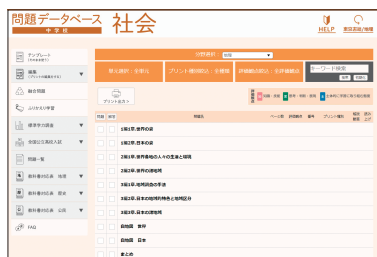
テンプレート画面

必要な環境 ●OS：①Windows 10/11, ②iOS 10以降, ③Android 8以降, Chrome OS ●ブラウザ*：Microsoft Edge ①, Safari ②, Google Chrome ①③ ●利用形態：クラウド配信 ●プラグイン等：端末にQRコードリーダーが必要。 ※最新版を強く推奨